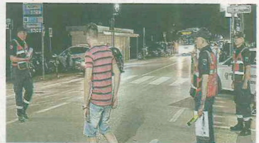
IN SERVIZIO Il posto di controllo di sabato sera a Marina

Nello stesso orario da una corriera di 30 ragazzi ne escono 4 con lattine e bottiglie di birra, tutti fermati con lo spauracchio delle mul-