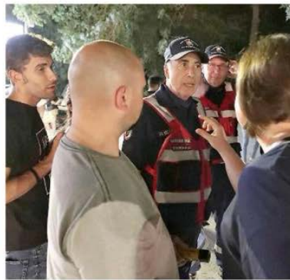
Colloquio tra gli uomini della Anc e i giovani a passeggio per Marina

Pattugliamenti da anni, ma è il primo che diamo a tutti la possibilità di fare l'alcoltest