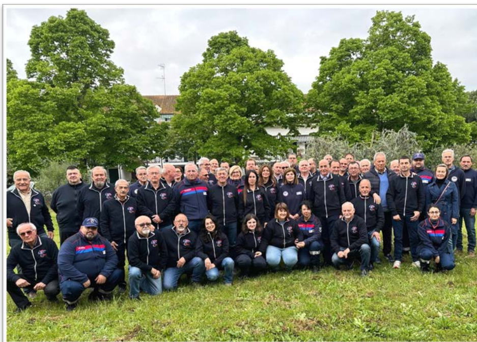
Dopo un momento formativo per acquisire nuove competenze sul tema della solidarietà.