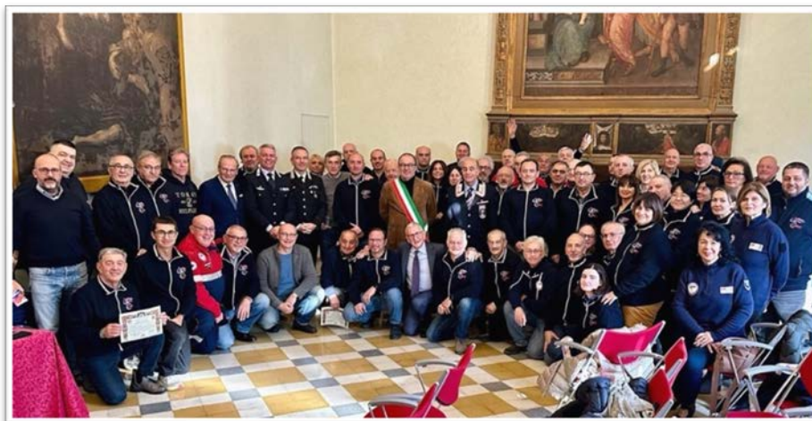
Assemblea dei soci volontari e autorità il 16 dicembre 2023, Sala Conferenze "Don Minzoni", Seminario Arcivescovile