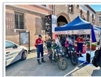
Genitori e bambini interessati a provare Gli Scooter