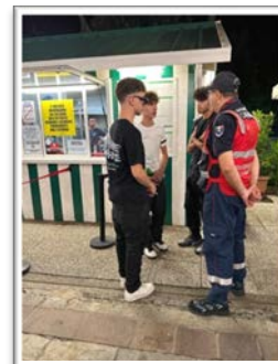
Ascolto dei giovani a Marina