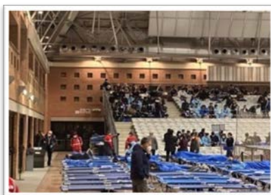
3 gennaio 2024, Pala De Andre, Ravenna identificazione e smistamento immigrati