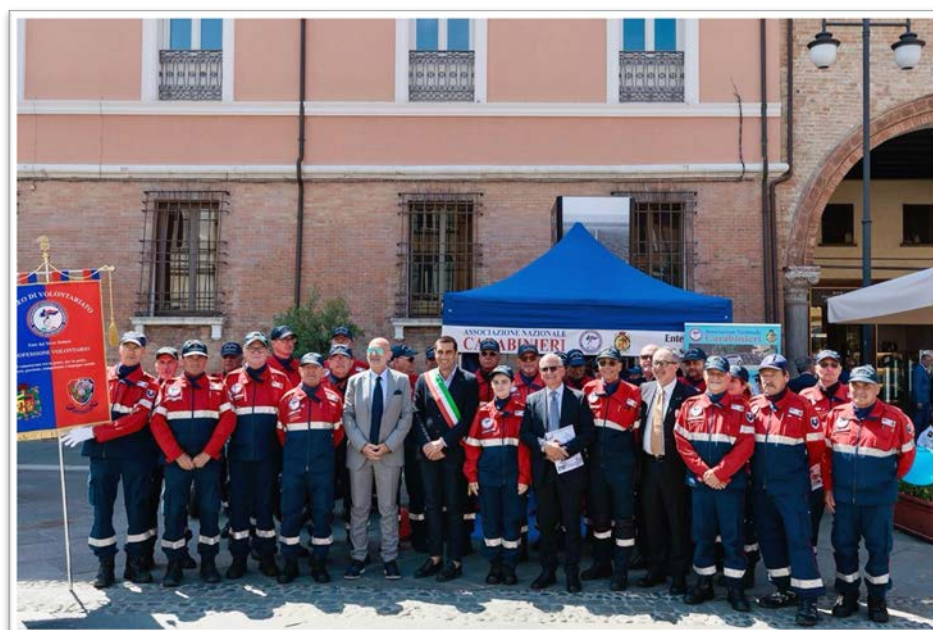
Gruppo di volontari impegnati nelle celebrazioni del 210° annuale della Fondazione dell'Arma dei Carabinieri, in Piazza del Popolo, il 2 giugno 2024