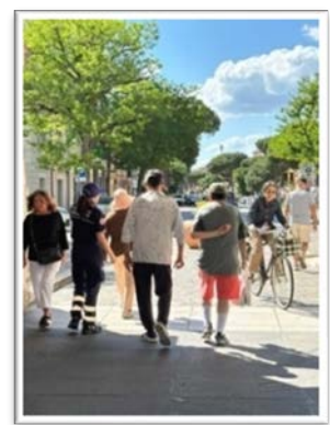
Alcuni momenti informativi a studenti e ai molti turisti, in aumento, nella nostra città