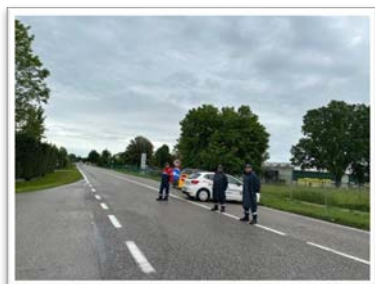
Presidio di zone allagate