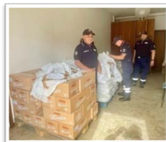
Consegna donazioni a favore di famiglie alluvionate

EVENTI e MANIFESTAZIONI che richiamano grandi masse di spettatori o partecipanti