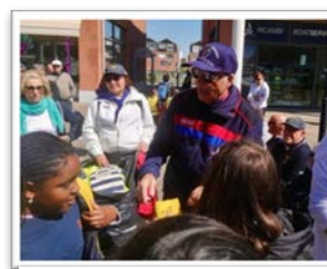
Incontro con giovani e anziani diversamente abili.

Pur mantenendo le stimmate, i valori, le tradizioni e la disciplina dell'Arma dei Carabinieri , il Nucleo si distingue per la sua inclusività e rappresenta uno dei principi fondamentali della nostra società moderna, in quanto promuove l'accettazione e la collaborazione tra individui provenienti da diversi contesti sociali, culturali e religiosi.