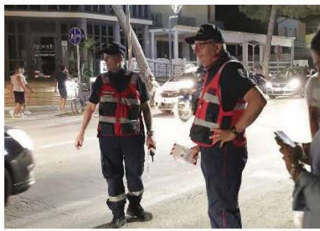
I volontari dell'Associazione nazionale carabinieri (Zani)

Su 1611 test per la verifica del tasso alcolemico, effettuati a Marina nei sabati notte dei due mesi di luglio e agosto, dal personale del Nucleo volontari dell'Associazione nazionale carabinieri, è emerso che il 60 per cento superava il limite consentito dal codice della strada, ovvero lo 0,50. Quasi i due terzi di questi avevano età fra i 25 e i 54 anni e la maggior frequenza (68 per cento) del superamento del limite è stata accertata fra l'una e le due di notte. È una sintesi dell'enorme mole di dati statistici che emergono dall'analitica relazione dei servizi, resa nota dall'Associazione di cui è presidente Isidoro Mimmi. «Un'attività che rientra a pieno titolo nella nostra finalità che è quella di sensibilizzare i cittadini a ogni livello, dalle scuole superiori alla strada, al binomio cultura e sicurezza nel più ampio progetto di riqualificazione socio-culturale nell'ambito della sicurezza urbana» evidenzia Mimmi, il quale spiega come la campagna estiva di sensibilizzazione all'uso «moderato e consapevole» delle bevande alcoliche sia stata avviata «in linea con il piano di sicurezza messo in campo dal Prefetto per arginare le frange della 'malamovida' not-