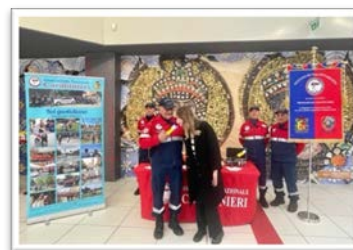
AlcoBlow presso centro commerciale ESP