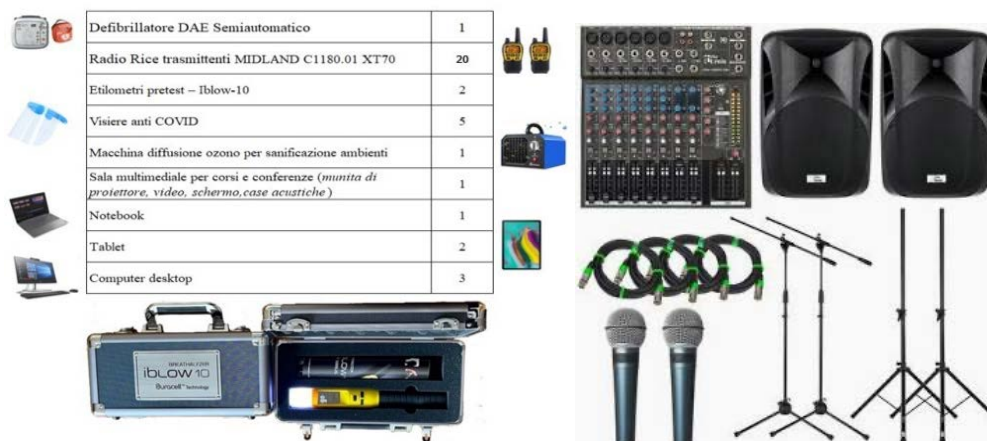
Impianto audio: una sorgente, un amplificatore, un mixer e due diffusori.