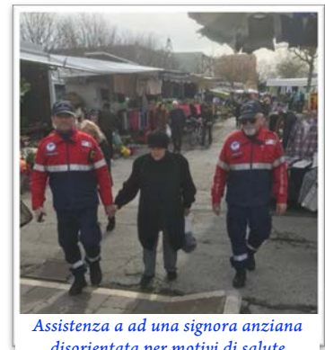
Assistenza a ad una signora anziana disorientata per motivi di salute

Il loro approccio professionale, positivo e coscienzioso ( la maggior parte sono padri di famiglia ), unito all'autorevolezza dell'uniforme con la scritta " Associazione Nazionale Carabinieri ", che richiama i valori dell'Arma dei Carabinieri, fa loro guadagnare la fiducia dei giovani, degli anziani e dei turisti. Questo contribuisce a creare un ambiente sicuro, migliorando la percezione della sicurezza urbana . L'organizzazione del loro servizio e la possibilità di mantenere contatti regolari con le forze dell'ordine hanno dimostrato di essere un valido deterrente .