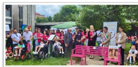
Collaborazione con il "Sorriso di Giada OdV" in progetti inclusivi